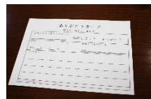
社員間のコミュニケーションを高める「ありがとうカード」を導入

「社員が一番の財産と考え健康経営に取り組んできた」様々な働き方改革の取り組みにより、「健康経営優良法人」に2017年から5年連続で認定。2021年には優良な上位500法人に対して新しく付与されることになった「ブライツ500」の認定も受けている。